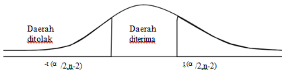
Gambar 2. Uji-t

Menunjukkan nilai signifikan dari tiap-tiap koefisien regresi terhadap kenyataan yang ada, langkah-langkah :